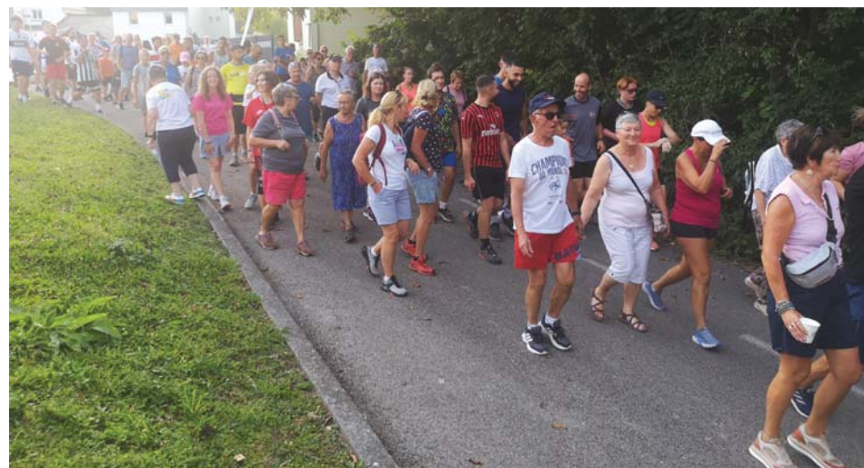
Un nombreux public a participé à la course contre Charcot.

On a battu des records de participation et de volume de dons lors de l'édition 2024 de la course contre Charcot qui a réuni plus de 250 personnes. Cette manifestation solidaire, organisée par Monique Ferciot et sa famille, avait pour objectif de sensibiliser l'opinion publique sur cette terrible maladie, mais également de recueillir des dons au profit de l'ARSLA (association pour la recherche sur la sclérose latérale amyotrophique). Cette association accompagne les malades dans leurs souffrances et soutient la recherche pour éradiquer la maladie. Outre la course sur des circuits de 2,8 ou 3,8 km, les organisateurs avaient prévu une buvette et un stand de restauration