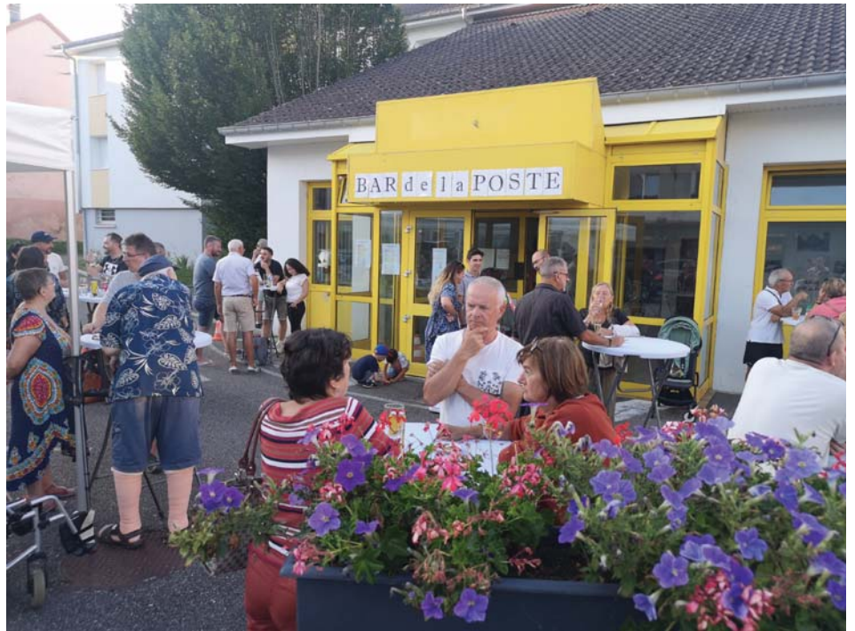
Le bar de la Poste a fait recette, notamment lors de la soirée du vendredi. Rendez-vous pour une nouvelle session en octobre !

Devant le succès de cette animation, les élus ont décidé de renouveler l'opération dès le mois prochain avec une nouvelle ouverture du bar éphémère, sans y être obligé par la législation, le vendredi 18 octobre à partir de 18h et le samedi 19 octobre de 17h à 22h.