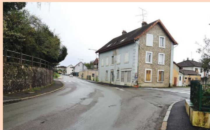
L'angle de la rue de Beaucourt, théâtre des investissements les plus importants.

La réflexion se poursuit pour la réfection de voirie du bas de la rue de Beaucourt (180.000 €) et pour la construction d'un nouveau vestiaire au stade (185.000 € ont été provisionnés), l'un des bâtiments présentant des fissures inquiétantes.