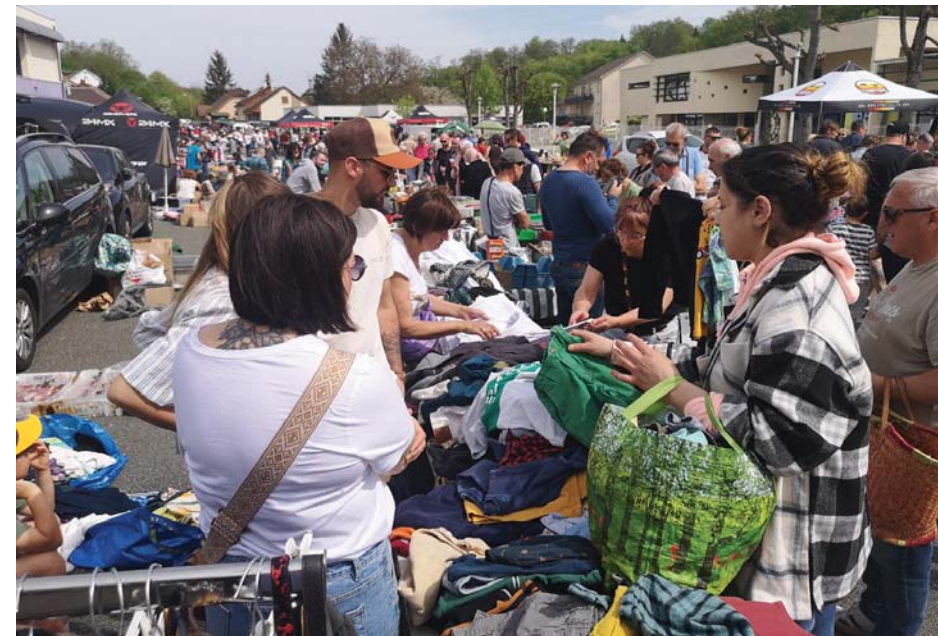
Le public a été nombreux dans les allées d'un bout à l'autre de la journée.

Trente ans déjà que la Brocante de Dampierre-les-Bois existe ! Au fil des années, ce rendez-vous est devenu incontournable pour les amateurs, qu'ils soient exposants ou « chasseurs de trésors ». Cette 30 ème édition a été une belle réussite, notamment grâce aux conditions météo de ce 1 er mai qui, pour une fois, ont été très favorables. Une bonne centaine d'exposants étaient présents, le flux des visiteurs a été important et constant tout au long de la journée et le stand de buvette/restauration, tenu par les membres du Comité des Fêtes, a été dévalisé !