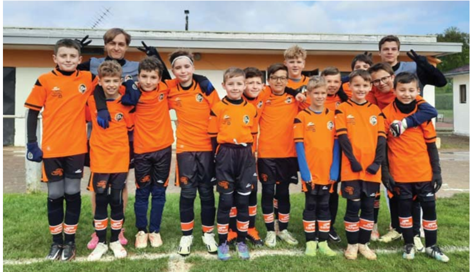
Les jeunes stagiaires de Dampierre-Foot.

À l'occasion des vacances scolaires d'avril, le club de Dampierre-Foot a organisé un stage de perfectionnement d'une semaine pour ses jeunes footballeurs de la catégorie U11. Ce stage a été encadré par deux joueurs de l'équipe première, avec du conditionnement physique, mais aussi de l'enseignement de concepts techniques et tactiques. A l'issue du stage, les jeunes footballeurs dampierrois ont reçu une tenue complète (avec les initiales de chaque joueur) siglée «Eldera», l'équipementier du Football-Club de Sochaux-Montbéliard. Du reste, le mercredi, les jeunes sont allés assister à l'entraînement des «Jaune et Bleu» au stade Bonal.