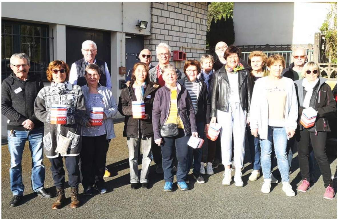
Le groupe de bénévoles qui a participé à la distribution des brioches.