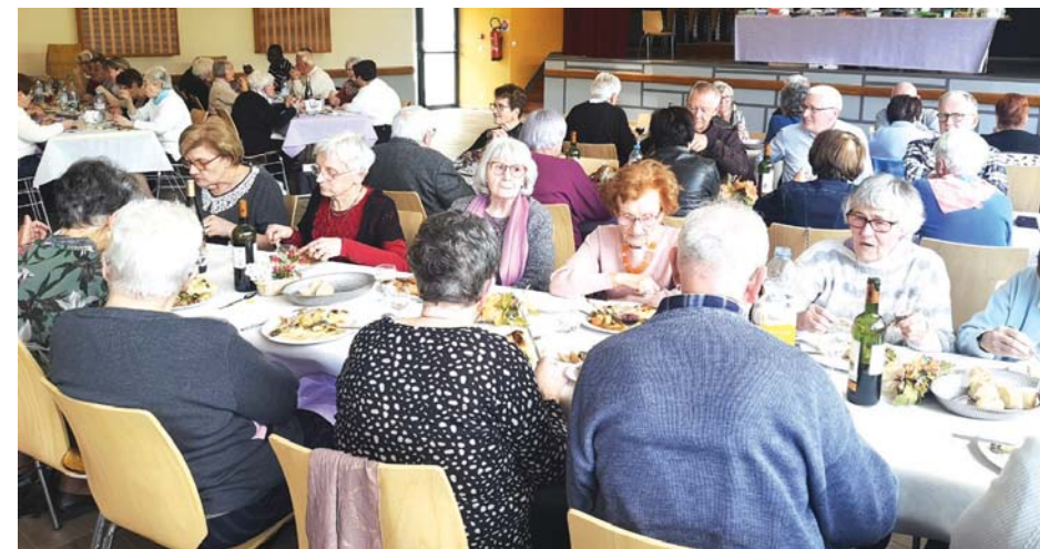
Une cinquantaine de personnes s'étaient inscrites au repas.

Le repas de la paroisse catholique «Dampierre Espoir et Vie» a réuni une cinquantaine de convives le 21 avril à la Salle des Fêtes. Vol au vent puis cuisse de pintade forestière et sa garniture étaient au menu de ce repas qui, l'après-midi, a été égayé par la traditionnelle tombola qui a permis aux plus chanceux de repartir les bras chargés.