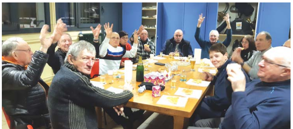
Moment galette pour les musiciens dampierrois et leurs homologues d'Audincourt.

Au mois de janvier, les musiciens de la batterie-fanfare l'Espérance se sont réunis pour tirer les rois avec leurs amis de la Vigilante d'Audincourt, qui les accompagnent souvent lors de leurs prestations. A signaler que le groupe dampierrois est toujours à la recherche de musiciens : les personnes intéressées peuvent venir se renseigner lors des répétitions (le jeudi à partir de 20h) au local dans la salle des fêtes.