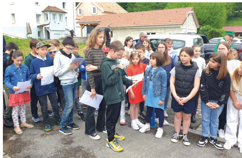
Au Monument, les écoliers ont lu le message du Ministre des anciens combattants.

Avant d'offrir quelques chants sous le préau de l'école à l'issue de la commémoration, les enfants se sont relayés pour lire le message du Ministre des anciens combattants au Monument aux Morts, interprétant ensuite la Marseillaise.