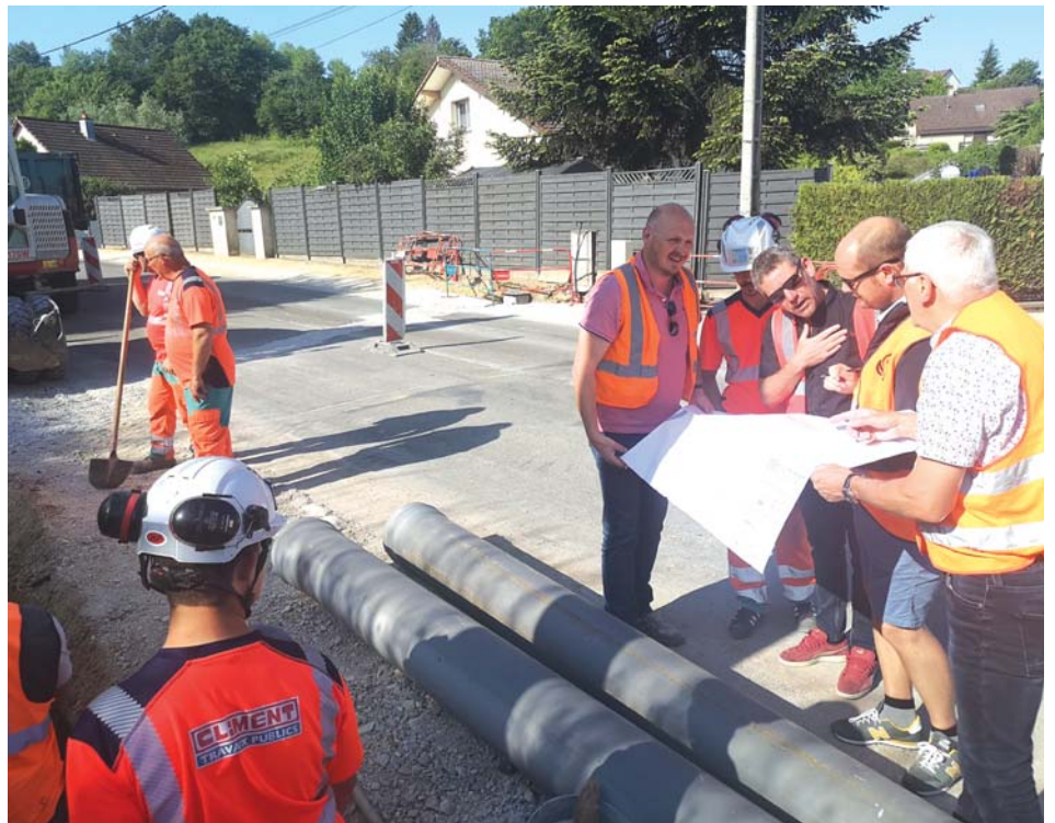
Réunion de chantier sur place avec le Maire et les différents intervenants.

D'ici là, le trafic routier est réglé en alternat par des feux de chantier mais, dans la mesure du possible, l'entreprise rouvre complètement la route la nuit et pendant les week-ends.