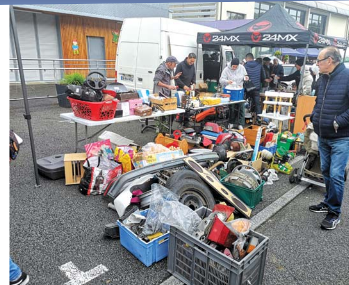
Le grand déballage de la brocante de Dampierre a attiré la grande foule tout au long de la journée.

La traditionnelle brocante du Comité des Fêtes organisée le 1 er mai a connu son succès coutumier avec des conditions météo favorables. Une bonne centaine d'emplacements avaient été réservés par les exposants qui ont pu faire de bonnes affaires grâce à un public en nombre tout au long de la journée. Du côté de la buvette et du stand de restauration, les bénévoles du Comité des Fêtes n'ont pas chômé, l'affluence étant importante dès les premières heures de la matinée.