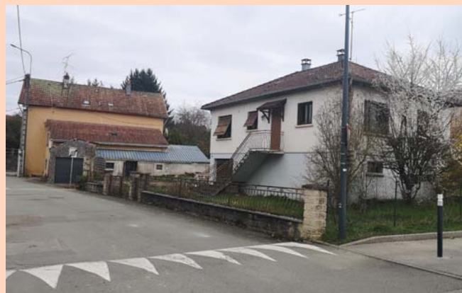
Des crédits ont été inscrits pour la démolition des deux immeubles.

Citons également la création d'une nouvelle allée au cimetière (21.000 €), le reboisement (18.900 €) et la rénovation du logement de l'ancien bureau de Poste en vue de sa future location (40.000 €).