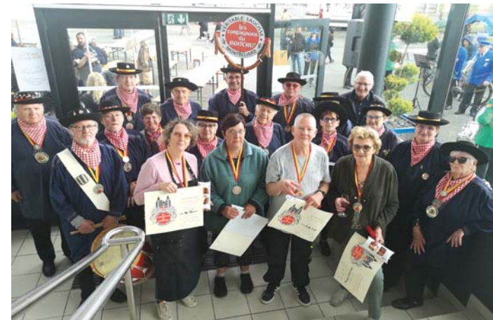
Les quatre nouveaux membres de la Compagnie du Boitchu avec une délégation de la confrérie.