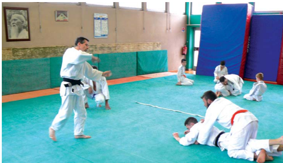
Le club de judo de Dampierre fêtera ses 50 ans d'existence le samedi 17 juin.