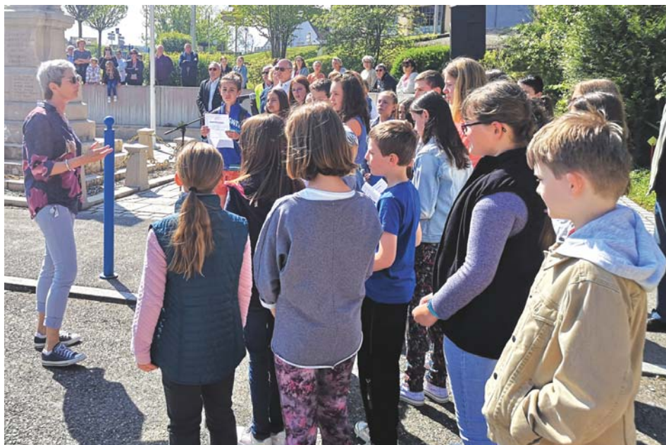
Les écoliers ont interprété la Marseillaise devant le Monument aux Morts.