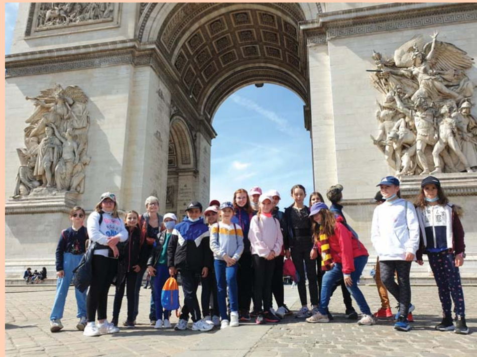
Une photo de groupe devant l'Arc de Triomphe, monument emblématique parisien.