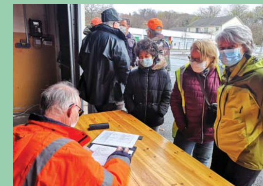
La répartition des équipes avant le départ...

Félicitations en tout cas à tous ces Dampierrois volontaires qui ont consacré une matinée à cette nécessaire opération de nettoyage.