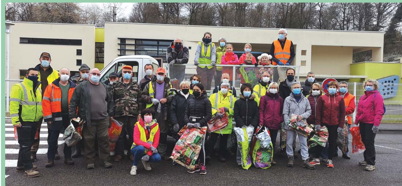
L'équipe des Dampierrois volontaires ayant participé à l'édition 2021 du nettoyage de printemps.

En raison du confinement strict d'avril 2020, cette opération n'avait pu avoir lieu l'an passé. Le traditionnel nettoyage de printemps s'est déroulé à peu près normalement le 10 avril dernier, dans le respect des consignes sanitaires bien évidemment.