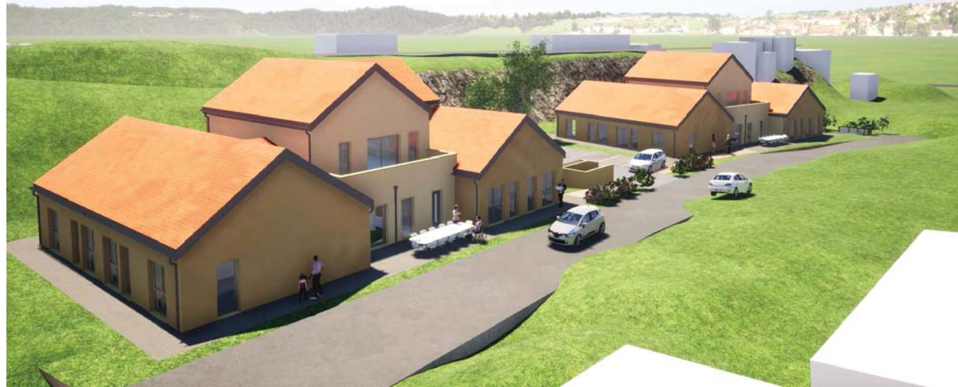
L'esquisse des deux maisons qui seront réalisées par Âges et Vie à destination des seniors en plein cœur de la ZAC Saint-Laurent.

Sur une surface de 25 ares, deux maisons d'environ 380 m 2 abritant huit logements seront construites. Deux logements supplémentaires sont prévus pour accueillir les auxiliaires de vie qui, en permanence sur place, veilleront sur les résidents en s'occupant (à la demande) de l'aide au lever, au coucher, à la toilette, aux déplacements. Le personnel sera également chargé de préparer les repas, d'assurer le ménage, l'entretien du linge, d'organiser les animations et la vie sociale.