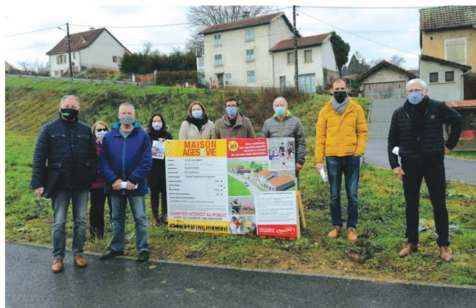
En décembre, les élus dampierrois ont rencontré des représentants de la société Âges et Vie.

Page Facebook : Love on the rocks Franche-Comté (25, 70, 39, 90) pour la Franche-Comté.