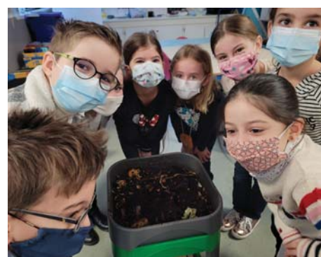
Nos amis les vers de terre...

Enfin, la dernière séance a évoqué le compost et le lombricompost : disposant d'un lombricomposteur à l'école, les enfants ont pu nourrir les vers de terre avec des épluchures. Ils les ont observés jusqu'aux vacances de février et savent désormais comment on fabrique du compost.