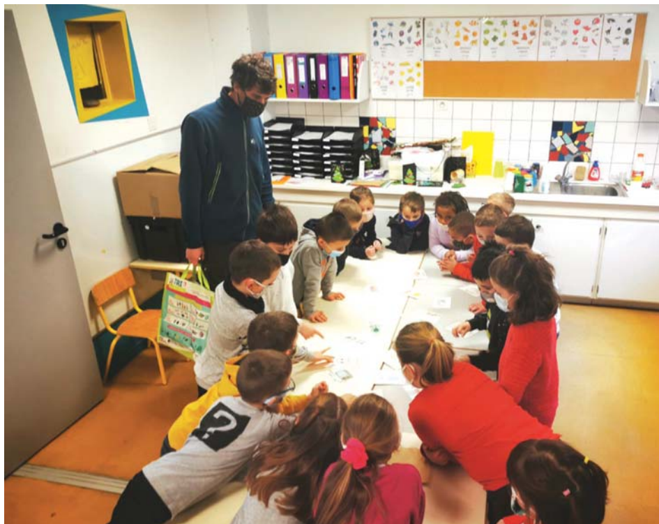
Les élèves ont suivi une vraie classe nature.