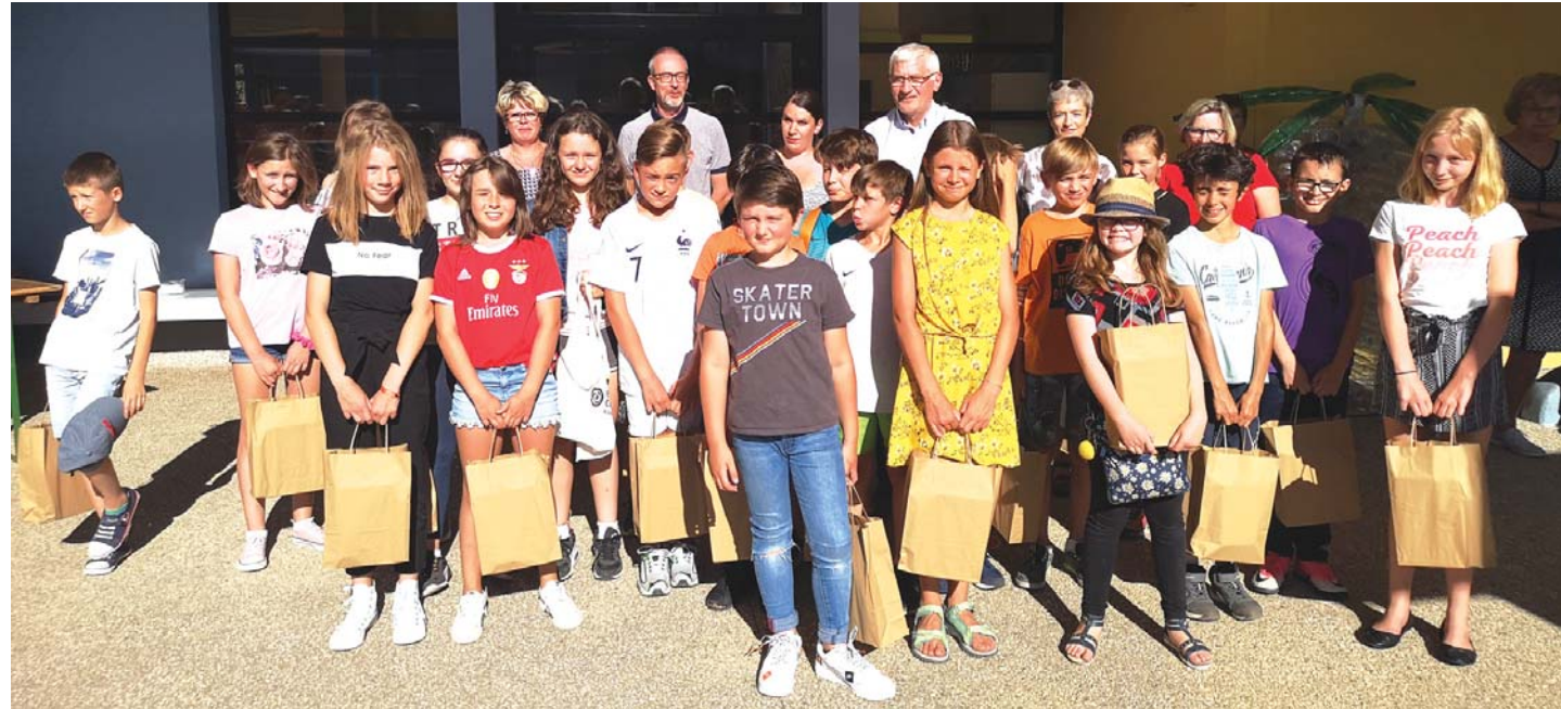
En compagnie des enseignants et du Maire, les élèves qui vont quitter l'école communale à la prochaine rentrée.

Comme le veut la tradition, les élèves de CM2 qui vont quitter l'école communale pour entrer en 6 ème ont été récompensés par la Municipalité. La cérémonie a eu pour cadre la cour de l'école élémentaire où les parents s'étaient joints à cette petite fête.