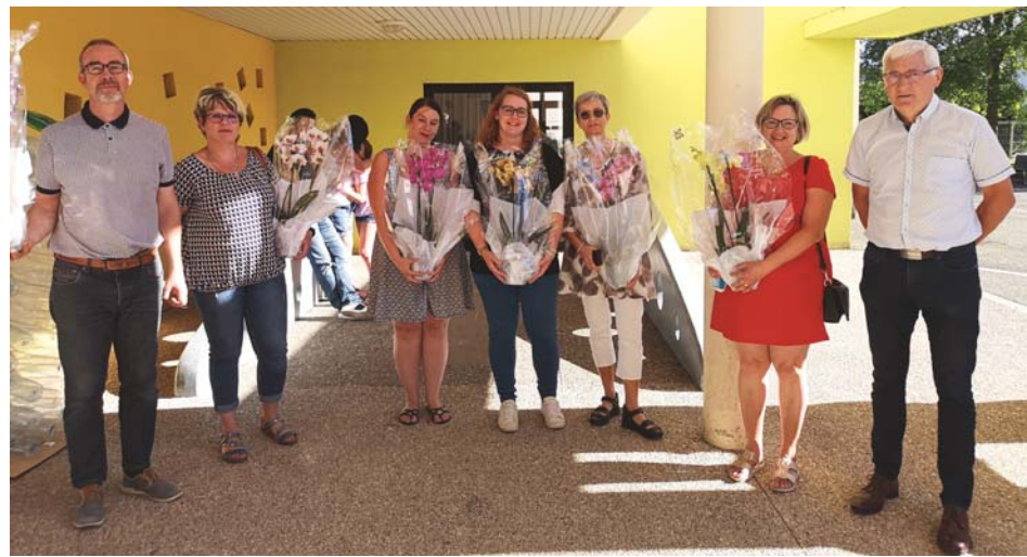
Les enseignants ont reçu un bouquet de fleurs.

Les élus leur ont ensuite remis un dictionnaire français, un dictionnaire français-anglais et une clé USB. Bonnes vacances !