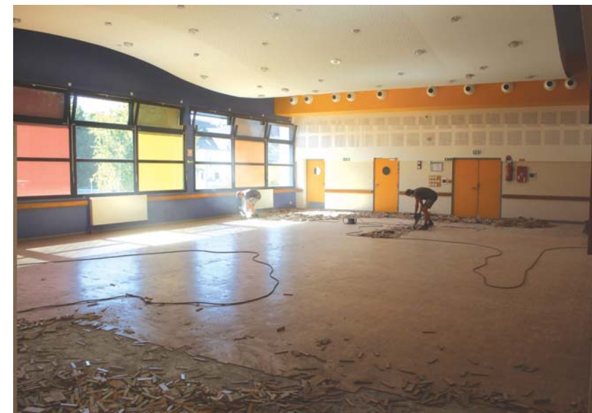
Les travaux ont débuté par l'enlèvement du vieux parquet.

Construite au début des années 60, la Salle des Fêtes a été rénovée et transformée en 2004. Seul le parquet de la grande salle, d'origine, avait été conservé.