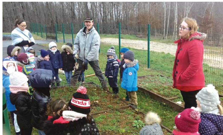
Atelier jardinage pour les petits de la maternelle.

Les petits de la maternelle ont participé récemment à un atelier jardinage. Suite à la demande d'un papa d'élève, l'école a mis en place un jardin à l'école. Avec les enseignants, les bambins ont commencé par préparer la terre pour les futurs plantations, installant