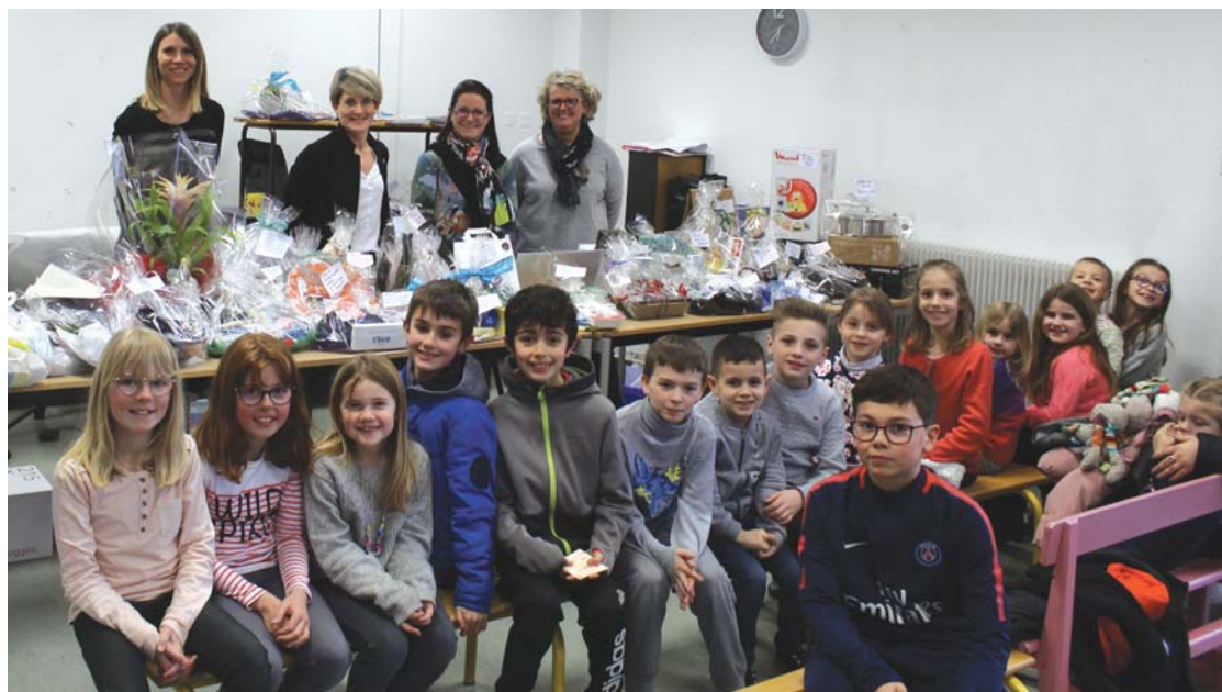
La tombola des Culottes Courtes a suscité un vif engouement.

L'association des Culottes Courtes, constituée de parents d'élèves volontaires, œuvre chaque année pour le financement des projets scolaires des écoles maternelle et primaire de Dampierre-les-Bois. La tombola organisée cette année, en plus d'autres actions ponctuelles, a rencontré un vif succès puisque ce sont près de 2 000 tickets qui ont été vendus, avec 140 lots distribués. Le tirage au sort des gagnants a eu lieu le mardi 10 mars en présence d'une cinquantaine de parents et enfants. Les lots ont été offerts gracieusement, en majorité, par les commerçants de la région, d'autres lots étant financés par l'association elle-même. Les responsables sont fiers de l'engouement provoqué par cette action et sont très heureux d'avoir contribué au bonheur des familles récompensées. C'est également une belle satisfaction que d'aider les enfants et les enseignants de la commune à réaliser leurs projets pédagogiques. Les Culottes Courtes tiennent à remercier vivement les commerçants pour leur générosité, les familles pour la vente des tickets, ainsi que les membres de l'association, sans qui rien n'aurait été possible !