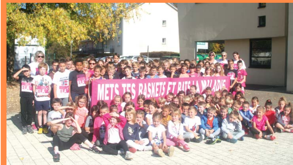
Les collégiens se sont mobilisés pour l'association ELA.

La traditionnelle journée consacrée à l'association ELA, qui lutte contre la leucodystrophie, a eu lieu le 15 octobre à l'école primaire. Après la dictée de la matinée, les élèves ont participé l'après-midi à l'épreuve de course à pied dans la cour de l'école.