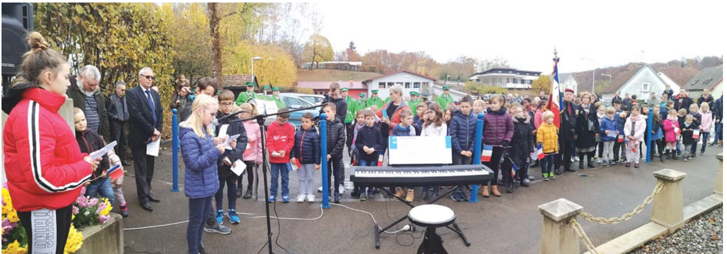
La commémoration du 11 novembre 1918 a connu une forte participation des enfants des écoles.

Le centenaire de l'Armistice a été commémoré en présence d'une nombreuse assemblée le dimanche 11 novembre en fin de matinée. Rassemblé sur la place de la Salle des Fêtes, le cortège s'est formé pour se rendre au cimetière où, après le lever des couleurs, les écoliers ont procédé à l'appel aux morts. Puis des gerbes de fleurs ont été déposées sur les tombes des Poilus, avant une minute de silence.