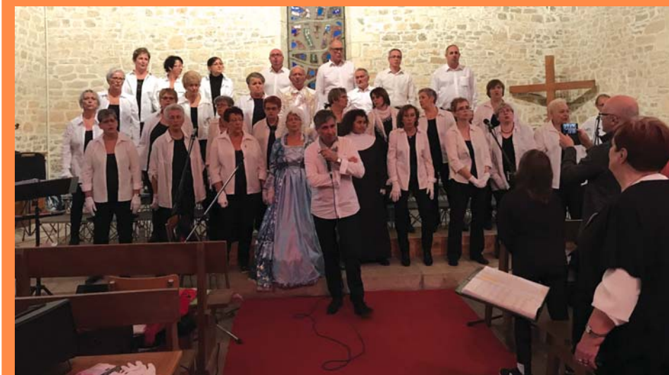
Les choristes de «La Clé de sol».

Le Temple a une nouvelle fois fait le plein à l'occasion du concert présenté par la chorale «La Clé de sol» le 28 octobre. Devant un public conquis, les choristes ont présenté un répertoire de variété française contemporaine. A noter que si l'entrée à ce concert, organisé par la paroisse protestante, était gratuite, le public a pu contribuer à la lutte contre la maladie de Charcot en offrant un don à l'ARSLA.