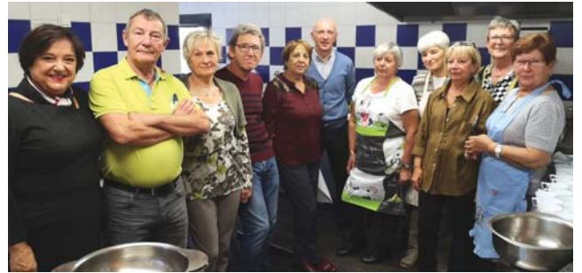
Les organisateurs de la journée.

L e traditionnel repas Lcomtois organisé par la Bibliothèque et la section Images de notre patrimoine a eu lieu le 4 novembre. Dans une bonne ambiance, les 120 convives ont dégusté un repas typiquement régional avec pommes de terre, saucisses et cancoillotte.