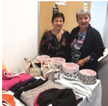
... de même que les couturières.

utiles ou décoratives, tandis que dans une salle à côté, elles invitaient à découvrir le «cabinet de curiosité». Avec un éclairage adapté, cet endroit présentait de drôles de sujets, un peu inquiétants parfois, toujours le fruit de l'imagination des artistes. Mais ils étaient facilement apprivoisables !