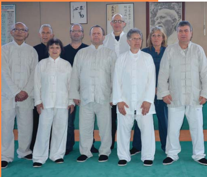
La section de Tai Chi Chuan existe depuis plus de trente ans au sein du Foyer des Jeunes de Dampierre.