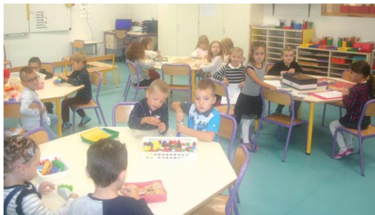
Les petits ont retrouvé leur école...