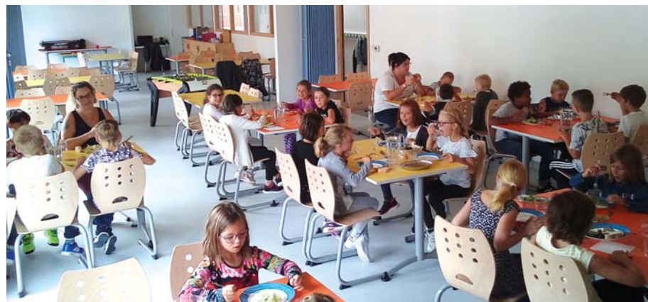
Le premier repas pris par les enfants dans le nouveau bâtiment dédié au périscolaire.

Les petits écoliers dampierrois ont repris le chemin de l'école au matin du 3 septembre. Ce numéro de septembre est l'occasion de faire le point sur cette rentrée scolaire.