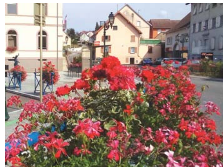
Si le fleurissement municipal a bien résisté à la canicule à Dampierre, c'est grâce à la cuve de récupération d'eau dont sont dotés les ateliers municipaux.

Les collectivités et les professionnels sont soumis aux mêmes règles , il leur est notamment interdit d'arroser les espaces verts publics et de laver les voiries. Quand cela est possible, les fontaines doivent également être fermées. Quant aux industriels, ils doivent mettre en place des plans d'économie d'eau. Cet arrêté a été mis en place pour une durée de deux mois (et pourra être prolongé en cas de nécessité) à compter du 12 septembre et les contrevenants s'exposent à une amende de 1.500 €.