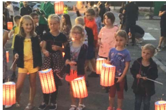
Le défilé aux lanternes de la Salle des Fêtes au stade pour les fêtes.