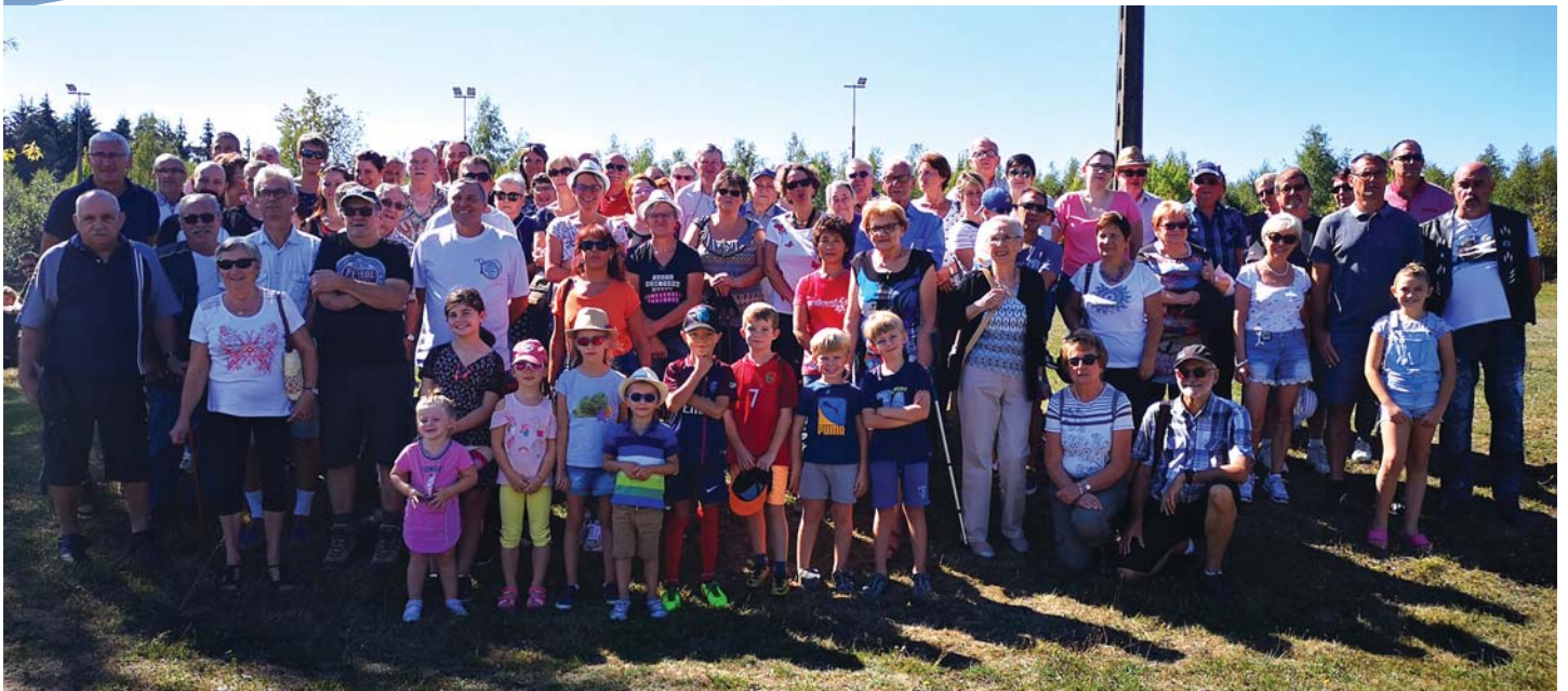
Une journée de convivialité afin de remercier l'engagement des bénévoles au sein des associations locales.

Pour la traditionnelle journée destinée à remercier tous les bénévoles qui se dévouent tout au long de l'année au sein des associations, la Municipalité a