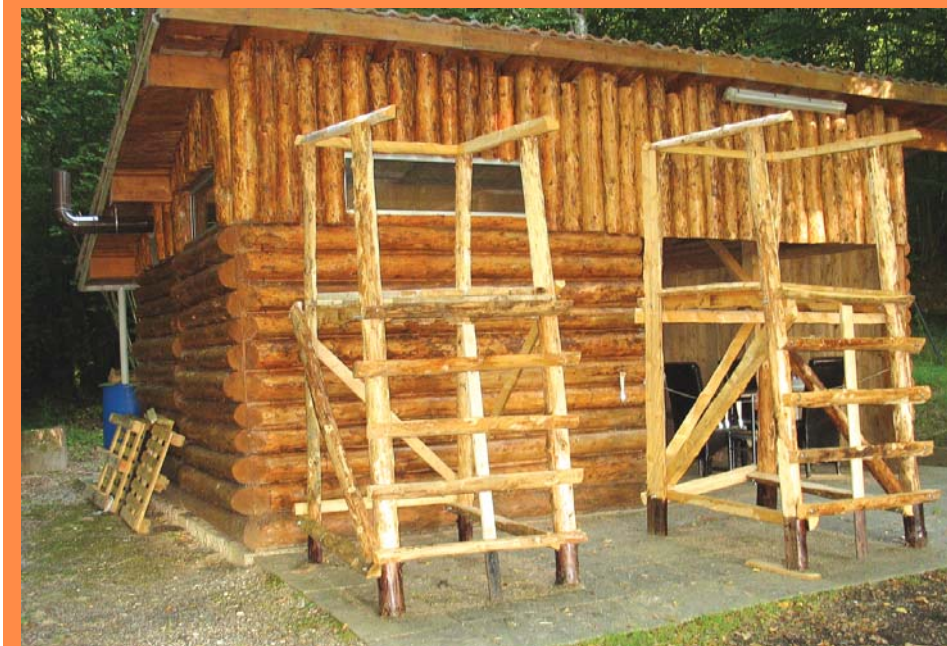
Un chalet rénové et des « chaises de tir » pour les chasseurs dampierrois.

Les chasseurs ont été très actifs cet été puisqu'ils ont effectué quelques travaux d'entretien sur le chalet de chasse. Le bâtiment a été pelé et enjolivé, il est désormais protégé des intempéries et prêt pour ravir les amoureux de la nature. Par ailleurs, les membres de l'association ont conçu et fabriqué huit chaises de tir afin d'améliorer la sécurité. Ces chaises ont été mises en place à des endroits stratégiques et vous pourrez les voir si vous vous baladez en forêt. Toutefois, il vous est demandé de respecter ce matériel qui n'est utilisable que par les chasseurs.