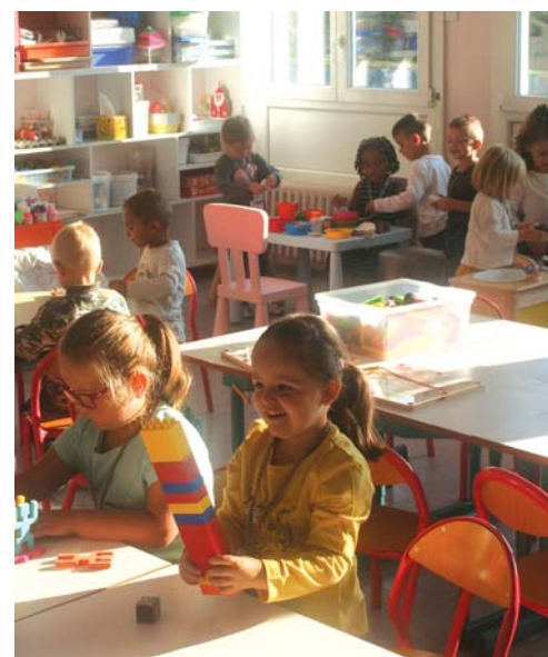
Premier jour d'école de l'année scolaire 2018/2019 pour les petits Dampierrois.