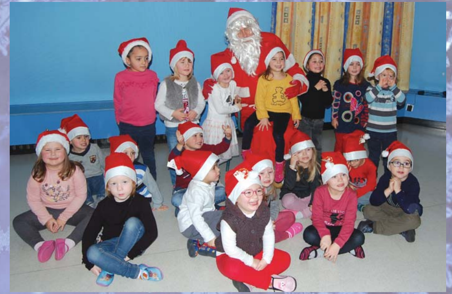
Visite du Père Noël à l'école maternelle...