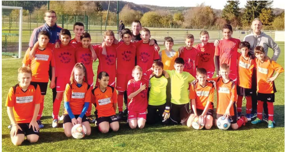
D'excellents résultats pour les jeunes footballeurs dampierrois.

Le groupe des U12-U13 du club de football de Dampierre a accompli un parcours exceptionnel au cours de la première partie de saison. Les jeunes ont en effet remporté tous leurs matches, obtenant le droit d'évoluer désormais en Ligue régionale 2, une compétition qu'ils vont débiter au printemps face aux meilleures équipes de la région. Félicitations à eux !