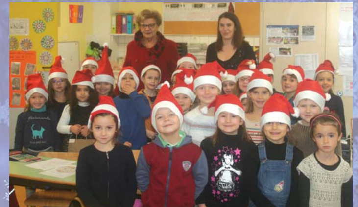
... et passage de conseillers municipaux à l'école élémentaire.