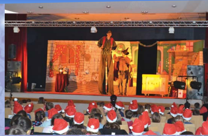
Pour l'arbre de Noël communal, les enfants ont assisté à un spectacle et ont eu droit à la visite du Père Noël.

Tradition respectée le 15 décembre dernier en fin d'après-midi avec le moment de convivialité offert par le Maire et ses Adjoints au pied de la Mairie. Vin chaud, crêpes, pain d'épices... et discussions dans la bonne humeur ont rythmé la soirée de bon nombre de Dampierrois qui avaient répondu à l'invitation des élus.