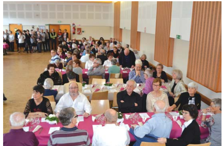
L'édition 2018 du repas des Seniors a rassemblé 160 participants.

Cent soixante convives ont participé au traditionnel repas des Seniors le 21 janvier à la Salle des Fêtes. Un moment toujours très convivial au cours duquel les élus et leurs conjoints, ainsi que les secrétaires de Mairie, se mettent en quatre pour permettre à leurs aînés de passer une bonne journée.