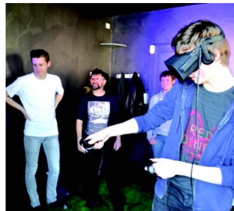
Des jeunes de l'UTBM sont récemment venir découvrir la réalité virtuelle.

Salle de réalité virtuelle, FM Informatique, ouverture du lundi au samedi de 9h à 12h et de 14h à 19h, le dimanche sur rendez-vous. Tarif de location : 15 € l'heure par personne (puis tarif dégressif suivant le nombre d'heures), interdit aux moins de 12 ans.