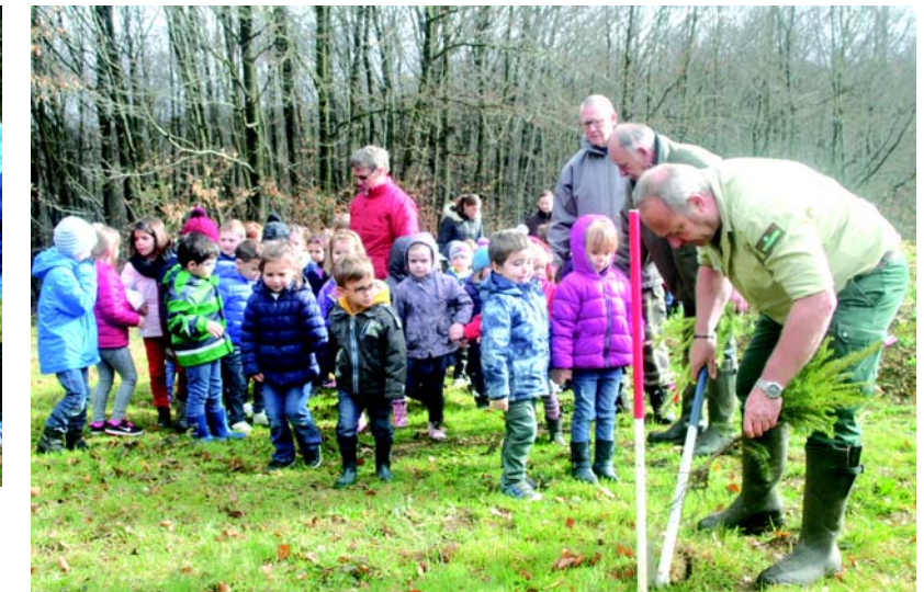
Les élèves de l'école maternelle ont suivi avec attention les conseils du garde-forestier pour la mise en place des petits sapins.

Les petits de la maternelle ont suivi récemment une classe «nature» : en compagnie du garde-forestier et des