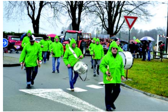
Les courageux musiciens de l'Espérance ont ouvert le défilé.