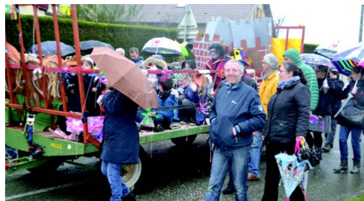
A l'heure du Carnaval, ce fut aussi le ballet des parapluies...

Au retour, le bonhomme Carnaval, passablement mouillé, s'est accordé un sursis : il a fini par flamber tandis que les enfants retrouvaient quelques forces avec le goûter offert.