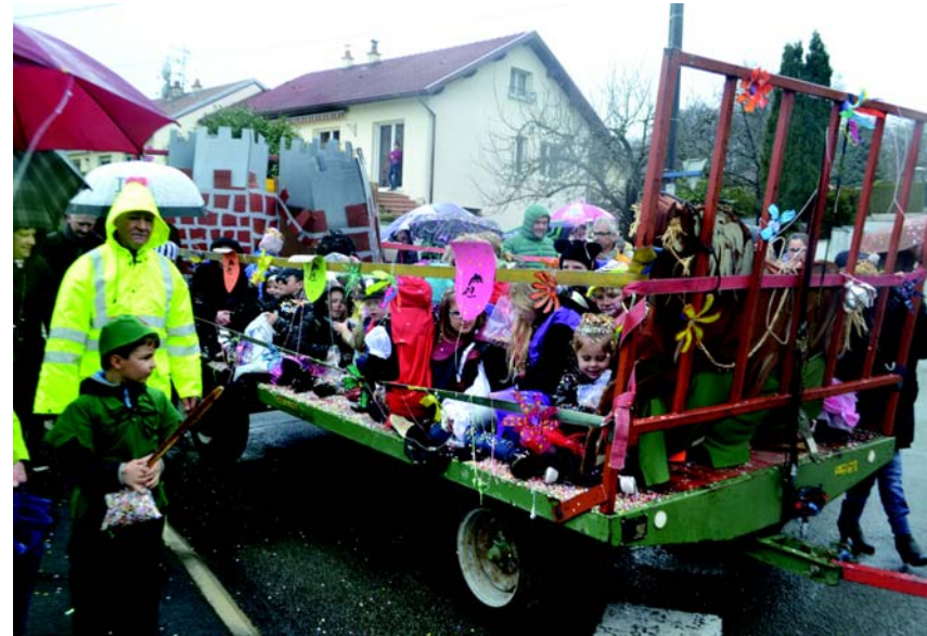
Les enfants avaient pris place dans le char...

Il avait fait beau toute la semaine précédente ! Les organisateurs étaient donc en droit d'espérer un soleil printanier pour l'édition 2017 du Carnaval des rues qui, en raison du plan Vigipirate, avait été déplacé dans le secteur du stade du Parcours.