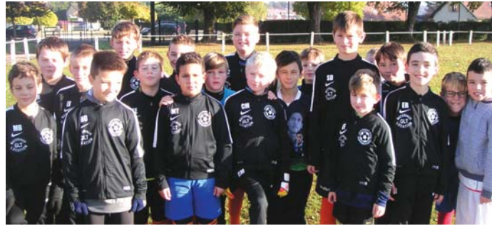
Les jeunes footballeurs U11, équipés de neuf...