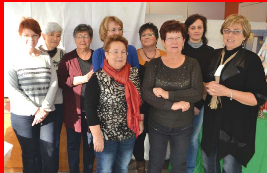
Les potières en compagnie des autres acteurs de cette journée, les responsables de la couture, de la peinture et de la bibliothèque.