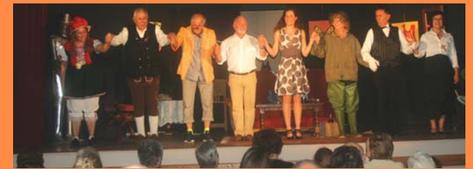
La troupe des «Tréteaux des Combes» a fait l'unanimité.

La troupe théâtrale de Louveaucourt «Les Tréteaux des Combes» était en représentation à Dampierre le 5 novembre et les comédiens ont présenté leur nouveau spectacle intitulé «T'emballer pas».