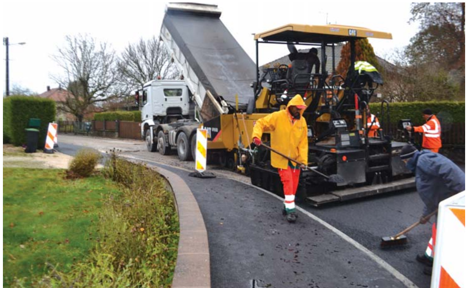
Le 17 novembre au matin, l'entreprise était à pied d'œuvre pour la pose de l'enrobé.

Commencés au mois de mai dernier, les travaux d'assainissement et de voirie réalisés sur la rue des Minerais ont connu leur épilogue à la mi-novembre avec la pose de l'enrobé final. Une issue très attendue par les riverains qui ont dû faire preuve de patience à l'occasion de ce long chantier motivé par la mise en conformité de l'assainissement (mise en séparatif du réseau) et remplacement de la conduite des eaux usées sur l'ensemble de la rue. Réalisés par Pays de Montbéliard Agglomération, ces travaux ont quelque peu bouleversé le quotidien des usagers, confrontés à des difficultés inévitables de circulation, le plus souvent réglées par des feux de chantier et une déviation par la rue des Petits Parterres. L'entreprise SADE a effectué les travaux d'assainissement, remplacement de la conduite et branchements des riverains, l'entreprise Climent prenant le relais pour la partie voirie, avec pose de bordure et