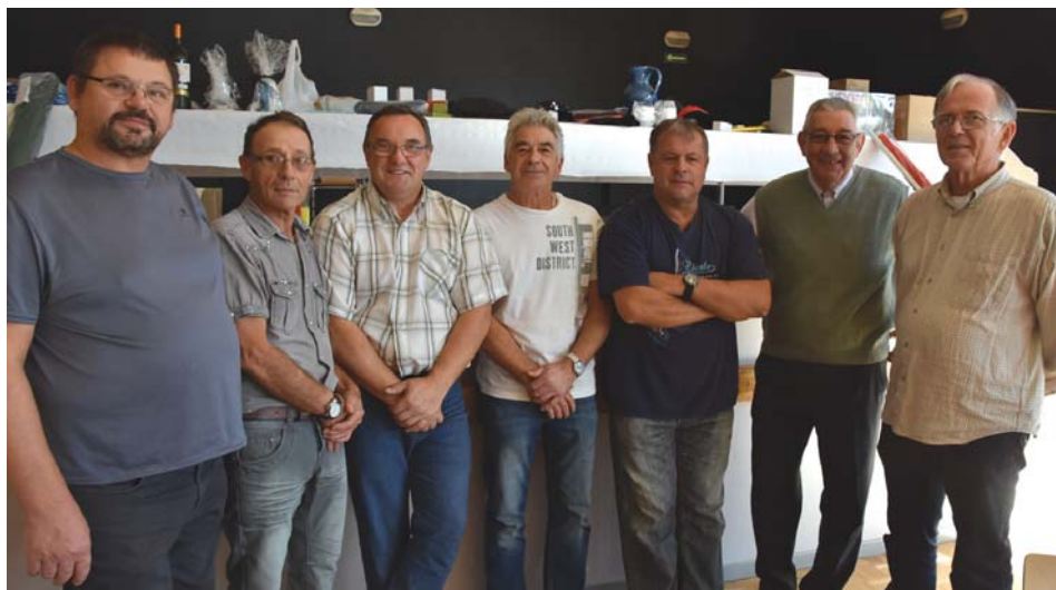
Les organisateurs de cette journée conviviale à Dampierre.

La société de pêche de Badevel/Dampierre-les-Bois organise chaque année des manifestations sur les deux communes. Le 16 octobre dernier, un repas-paëlla a été proposé à la Salle des Fêtes de Dampierre et 120 convives l'ont partagé dans une excellente ambiance. La journée a été agrémentée d'une belle tombola dotée de lots offerts par les commerçants et artisans locaux que les responsables de l'association remercient vivement.